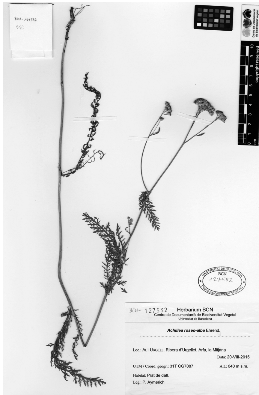
Figura 2. Plec d'herbari d' A. roseoalba recollectat a Arfa, Alt Urgell (BCN 127532).

haviem observat plantes molt similars més al sud, en un prat d'Organyà (UTM 31TCG6174, 590 m), que tot i no haver-les retrobat darrerament considerem que molt probablement també corresponien a A. roseoalba .