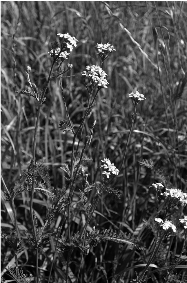
Figura 1. Achillea roseoalba en un prat de dall de l'Alt Urgell, aspecte general de la planta.